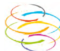
Umanità Nuova - Movimento dei Focolari