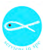
Federazione Nazionale Società di San Vincenzo De Paoli