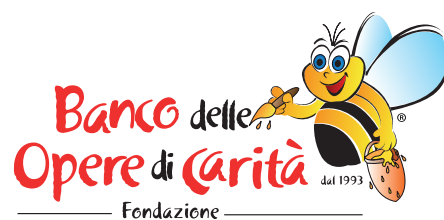
Fondazione Banco delle Opere di Carità Onlus