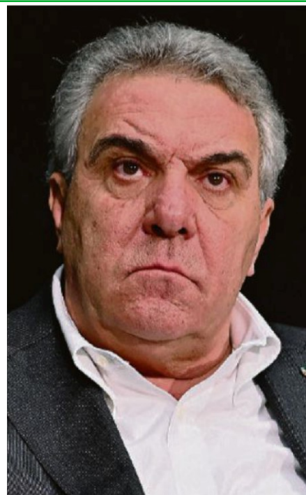
SINDACALISTA Luigi Sbarra , Cisl